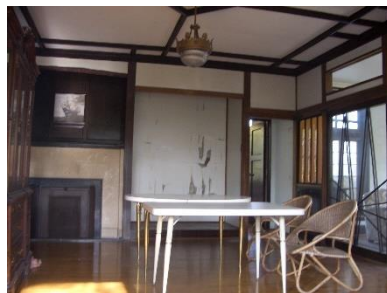
床の間と格天井の居間