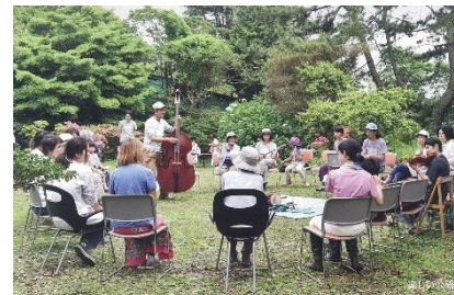
旧モーガン邸を守る会の活動写真