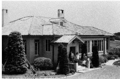
創建時のモーガン邸の全景写真