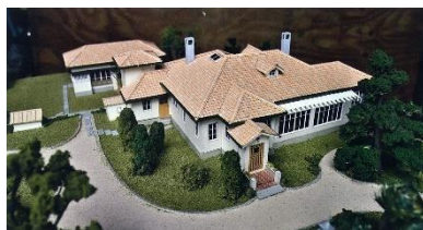
J.H.モーガン邸 模型写真