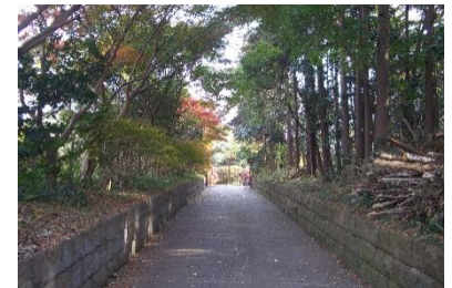
門から中門に至る緑豊かなアプローチ