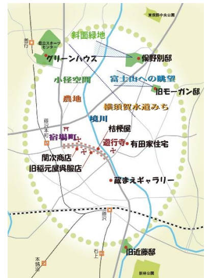
近隣の資源ネットワーク図