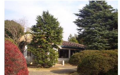
庭のシンボルでもあるレバノン杉の大木とモーガン邸