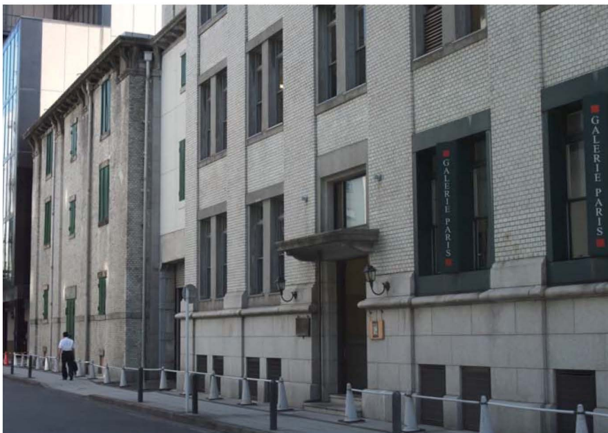
旧三井物産株式会社横浜支店事務所棟（手前）と倉庫（奥）

旧三井物産横浜支店倉庫は、建造物として重要文化財級の高い歴史的価値、学術的価値を有するのみならず、「富岡製糸場と絹産業遺産群」の世界遺産登録を受けて、その充実と展開を図る世界遺産候補「日本のシルク遺産群」の構成要素となるうる資質をも有している。旧三井物産横浜支店<倉庫>建築は、「日本のシルク遺産群」を構想する場合、<横浜>でのシルク遺産としてエントリー可能な唯一の遺産であり、まさにヨコハマヘリテイジそのものである。決して喪つてはならない。