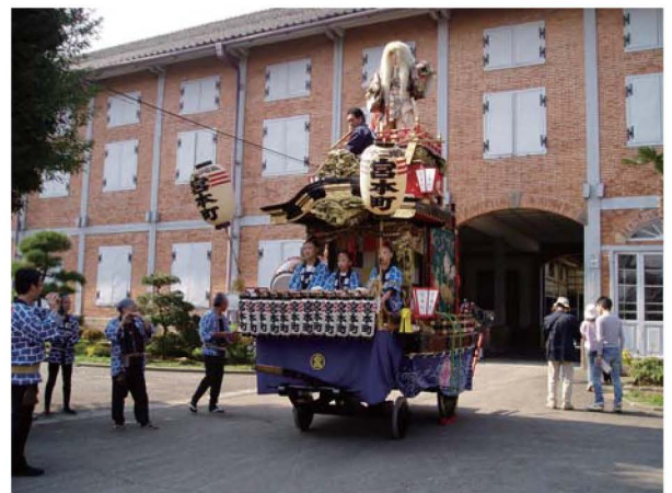
富岡製糸場（世界文化遺産）