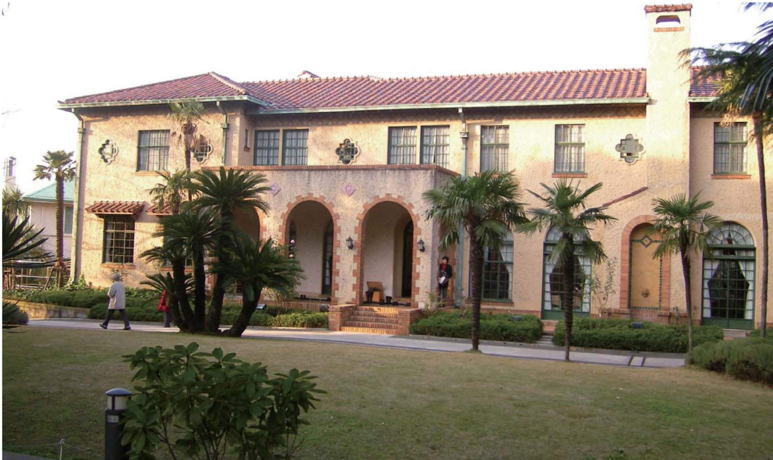
ペリック・ホール この西洋館を建てた商人も生糸貿易をおこなっており、生糸貿易の富によって山手を彩った西洋館が建てられたといっても過言ではない