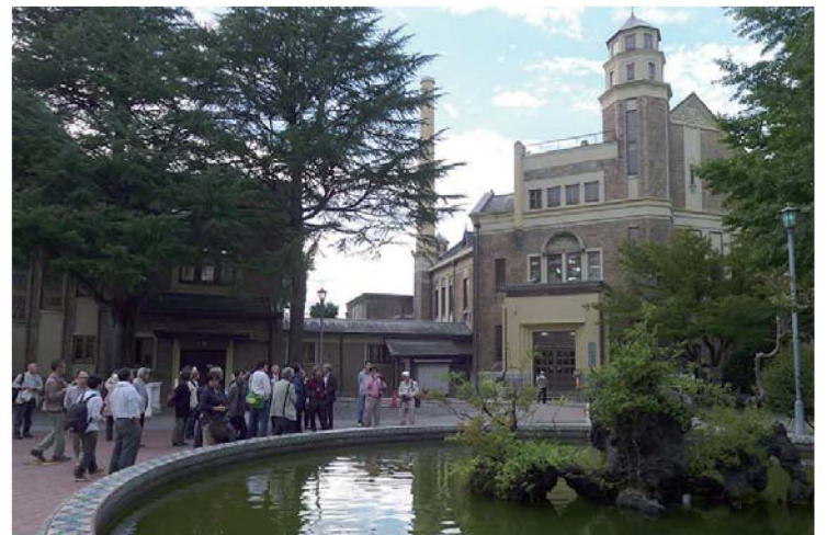
片倉が市民厚生施設として建築した温泉片倉館（国指定重要文化財）

平成26年9月20日(土)、21日(日)に岡谷市を拠点にNPO法人街、建築、文化再生集団(RAC)主催研究会が開催。当社団と連携し来る来年2月21日(土)に横浜で開催する前哨戦で信州シルクの拠点をあえて会場とした。諏訪湖沿岸の岡谷市を中心とした諏訪地方は幕末・明治・大正期を中心に製糸業が栄え横浜との交流が盛んでした。諏訪地方の生糸は当初、和田峠を越え、諏訪地方の製糸家による嘆願で出来た信越本線大屋駅から鉄道で横浜に運ばれました。今の中央本線が諏訪地方に延伸したのは明治39年。横浜への道のりは一気に改善されました。巨万の富をもたらした製糸家の子孫は今でも横浜との絆を先祖から受け継いだ宝として大切にしています。