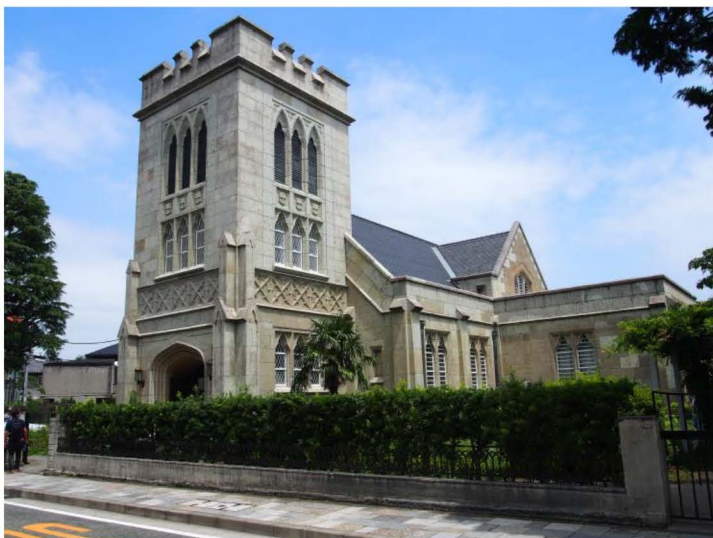
会場となった横浜山手聖公会