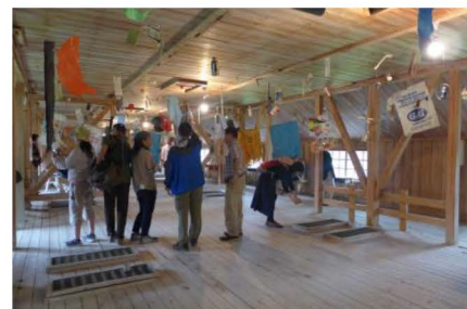
「原蚕の杜」の現代アート展示

※ 本フォーラムは平成 28 年 6 月 25・26 日の両日、山形県新庄市にて開催。