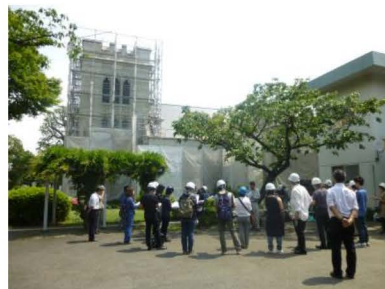
山手聖公会 大谷石施工現場見学会の様子