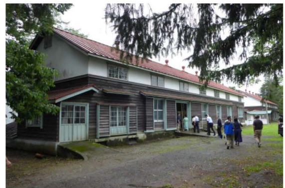
新庄市蚕糸試験場「原蚕の杜」(国登録有形文化財)