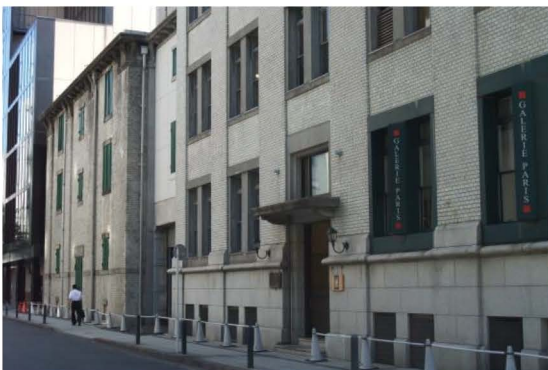
取り壊された三井物産横浜支店倉庫

中でも圧巻はエコロジーガーデン「原蚕の杜」である。昭和11年に事業が開始された旧蚕糸試験場新庄支場は、そのスケールといい、庁舎や蚕室などの当時の施設がそのまま残された景観といい、見る者を圧倒して魅了する。期待以上のシルク遺産であった。大きな桑の木の並木道、広大な敷地に点在する赤い屋根がのった白い建物たち。その牧歌的な風景は新庄の透明感ある空気の中で輝きを放っていた。蚕糸研究の歴史を紹介する場だが、宮沢賢治の童話の舞台になりそうな風景にすっかり心を奪われてしまった。「原蚕の杜」に再来の約束を告げ、鉄のシルクロードに乗って、一路横浜を目指した。