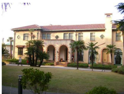
緑の協会で管理運営する山手西洋館「ベーリックホール」